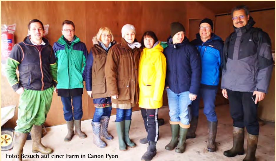
Foto: Besuch auf einer Farm in Canon Pyon